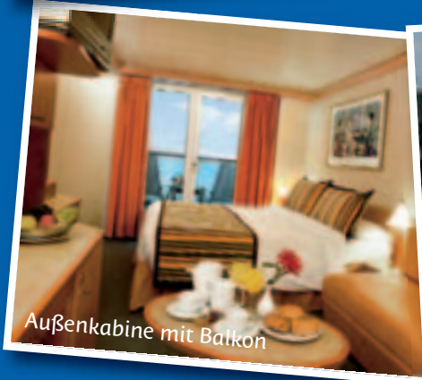
Außenkabine mit Balkon